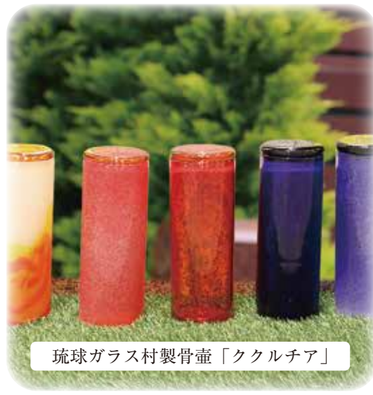
琉球ガラス村製骨壺「ククルチア」

フラワージュ専用の琉球ガラス村製骨壺 「ククルチア」は、沖縄の伝統工芸「琉球 ガラス」を使用しています。一つ一つ職人が 手作りで仕上げますので、同じものは二つ とありません。スタイリッシュな見た目と、 沖縄を思わせる美しいデザインが心を引く この骨壺には、名前を彫刻できます。手 作りの骨壺、それは樹木葬を探される皆 様に向けた、フラワージュのこだわりです。